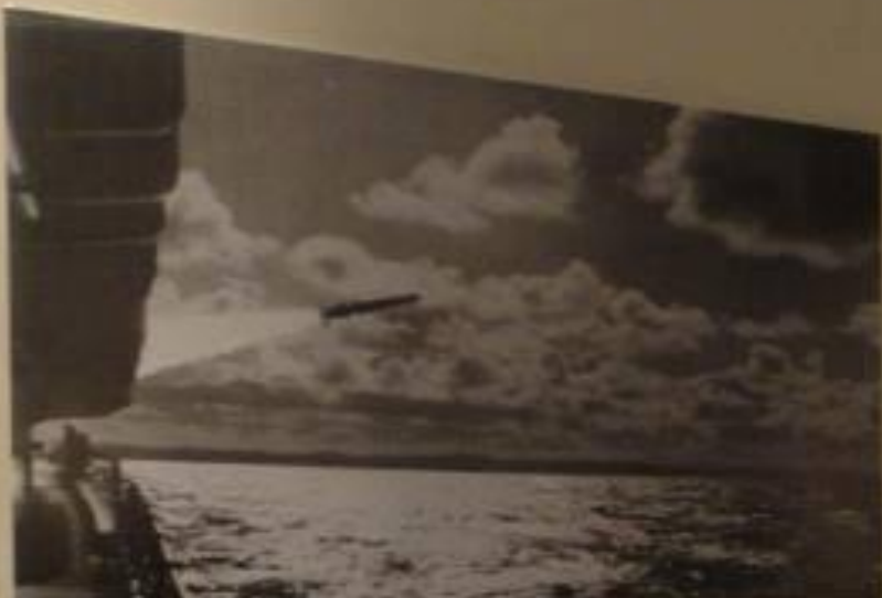
HMS Invincible, el portaaviones británico que participó en la guerra de Malvinas. Fue el único portaaviones de la Armada Real Británica que participó en la guerra.

El domingo 4 de abril zarparon las primeras naves inglesas desde Port Stanley. La fuerza naval movilizada por Gran Bretaña estaba conformada por dos portaaviones, 20 aviones Harrier, una escuadrilla de helicópteros Sea King, cerca de 40 buques de asalto, destructores, fragatas misilísticas, el submarino nuclear Conqueror y cerca de 3.000 efectivos. La flota equivalió a los dos tercios de la Marina Real. El 7 de abril los ingleses arribaron a la zona e iniciaron el bloqueo naval a las islas, creando un límite de exclusión de 373 km (230 millas náuticas). A partir del 30 de abril comenzaron las hostilidades de la aviación inglesa. El 1 de mayo fragatas británicas bombardearon Puerto Argentino, pero los intentos de desembarco fueron rechazados por la aviación argentina. El 2 de mayo, mientras el buque General Belgrano navegaba fuera de la zona de exclusión, recibió dos impactos del submarino Conqueror que provocaron su hundimiento. Murieron 323 soldados, en la mayor tragedia naval de la historia argentina.