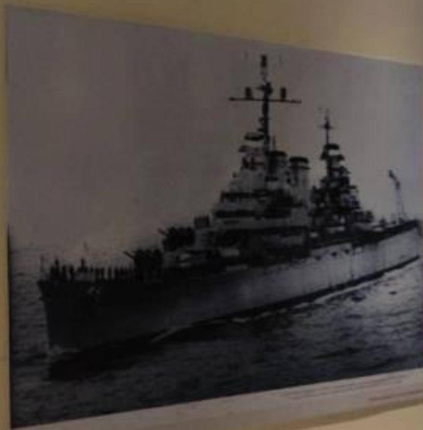
Submarino ARA Conqueror (S-32) en el momento de ser hundido por el portaaviones HMS Invincible.

ARMADA ARGENTINA. 20 años de guerra de Malvinas